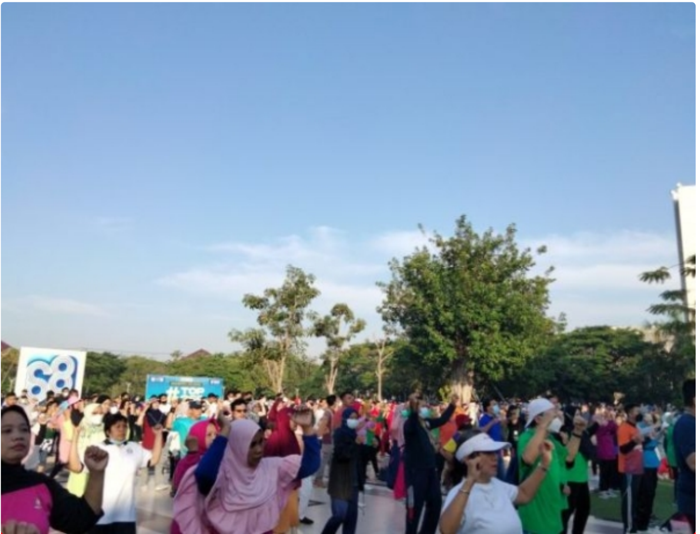
Senam Bersama

SURABAYA – Dalam rangka memperingati Dies Natalis dan Pendidikan Dokter