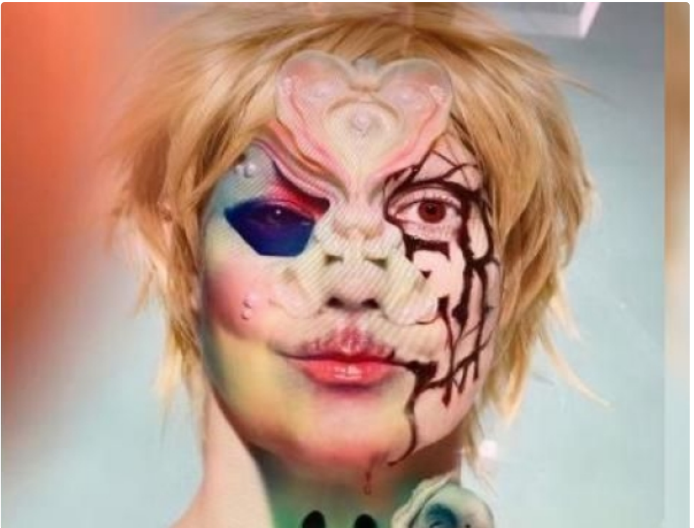
Ilustrasi Hacker Bjorka.

SURABAYA – Hacker Bjorka muncul dengan klaim membocorkan data pribadi para pejabat pemerintahan dan data-data negara di Indonesia. Masyarakat menanggapiinya secara pro kontra.